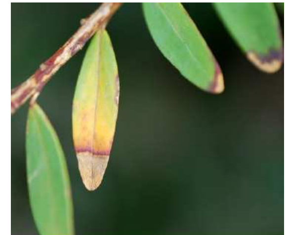
Brunissement à Xylella fastidiosa sur Polygala myrtifolia