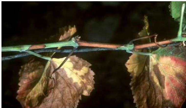
Xylella fastidiosa sur Vitis vinifera

Le non-aoûtement au niveau des nœuds est un symptôme spécifique qui doit fortement alerter.