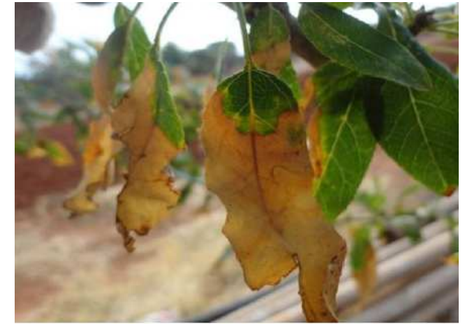
Brunissement foliaire à Xylella fastidiosa sur Prunus amygdalus